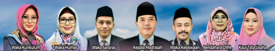
Waka Kurikulum Waka Humas Waka Sarpras Kepala Madrasah Waka Kesiswaan Bendahara DIPA Kaur/Tata Usaha

DIBUKA SECARA ONLINE DAN OFFLINE TANGGAL 31 JANUARI - 29 FEBRUARI 2024